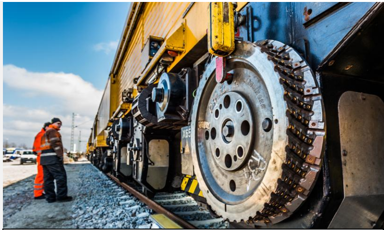
Schienenfräszug im Einsatz.

Projekt: DamagePredictionTool, 2022-2025. multi-firm